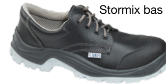
Stormix bas cap S3 CI SRC