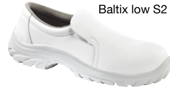
Baltix low S2 SRC