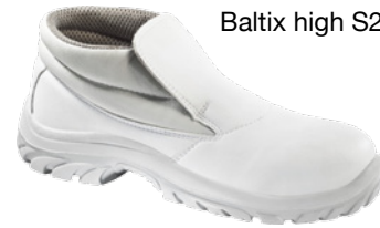
Baltix high S2 SRC