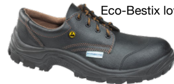
Eco-Bestix low S3 ESD SRC