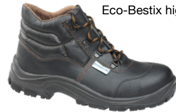
Eco-Bestix high S3 SRC