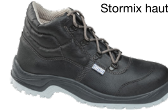
Stormix haut cap S3 CI SRC